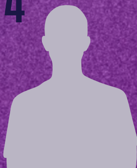
KEIL JANNIS 4