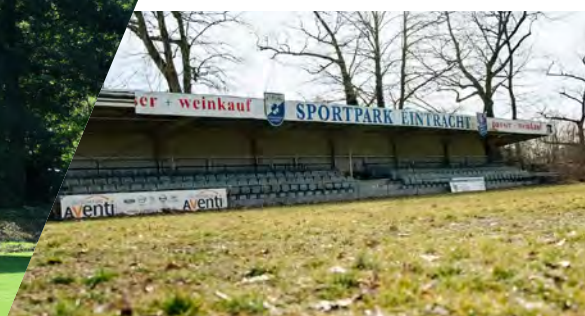
Das Jugendstadion vorher

Mit der Errichtung des neuen Jugendstadions setzt der FC Eintracht Bamberg ein klares und nachhaltiges Zeichen: für die Zukunft des Vereins, für leistungsorientierte Nachwuchsarbeit – und vor allem für seine Jugend. Getreu dem Leitsatz „Steine statt Beine“ hat sich die Vorstandschaft bewusst dazu entschlossen, einen sechsstelligen Betrag in die umfassende Ertüchtigung des ehemaligen „O8er“-Stadions auf dem Vereinsgelände zu investieren. Ziel war es, unseren Leistungsmannschaften im Jugendbereich eine dauerhafte sportliche Heimat zu geben.